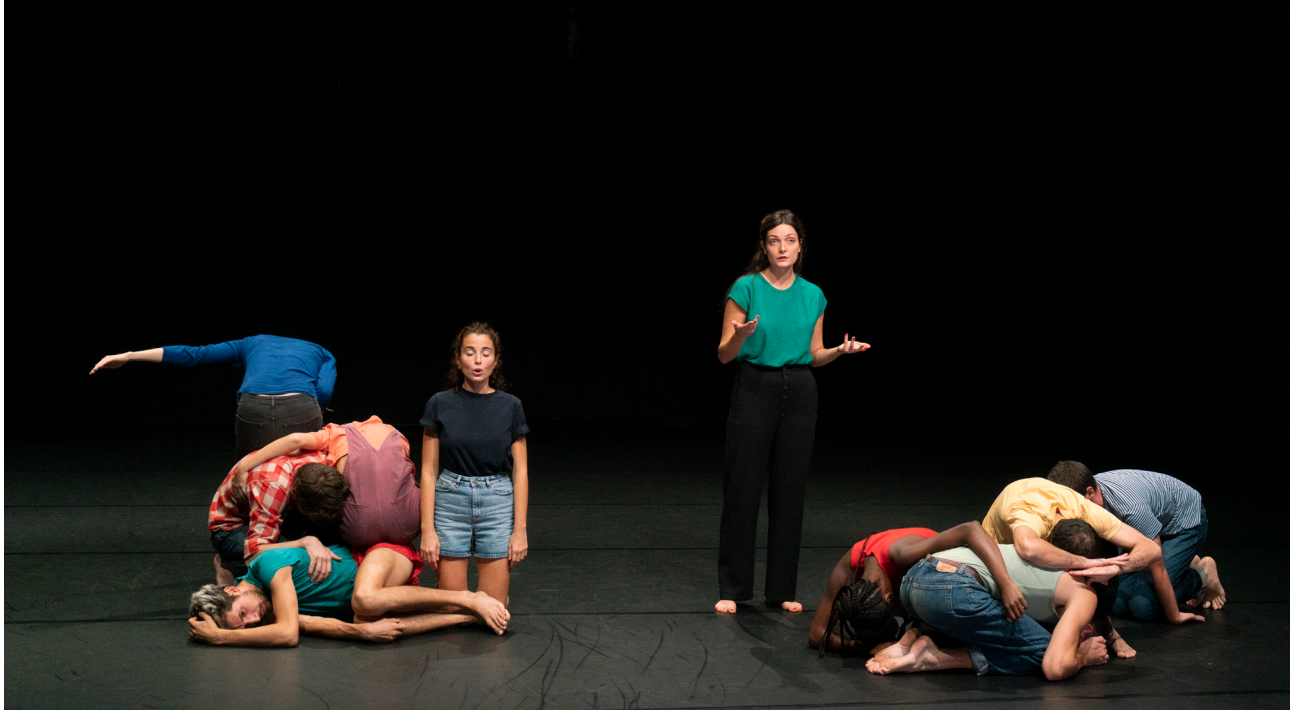
Le Choeur